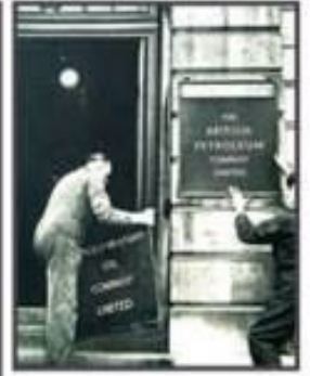
Orta Doğu Ülkelerinde ilk petrol keşif yılları