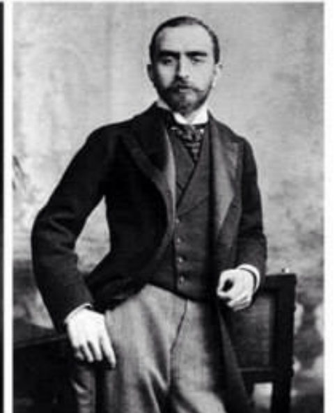
Gölbenkyan (Mr. Five Percent)

Ortak olarak aldığı Burmah Oil şirketi, arama faaliyetlerini durdurma kararı almış ve Reynolds'a Mayıs ayının başında bir telgraf göndermiştir. Telgraf Reynolds'ın eline geç mi ulaşır yoksa Reynolds telgrafta yazan direktifleri yerine getirmede mi gecikti bilirmes ama, arama faaliyetleri devam ettir ve 26 Mayıs 1908 tarihinde İran'ın Masjed Süleyman şehrinde büyük bir petrol keşif yapmıştır. Bunun üzerine 1909 yılında Burmah Oil bağlı kuruluş olan Anglo Persian Oil (APOC) şirketini kurmuştur. D'Arcy'nin harcadığı arama yatırımları bu şirket tarafından tazmin edilmiş ve bu yeni kurulan şirkete Direktör olmuş ve 1917 yılında ölümüne kadar petrol aramalarına devam etmiştir. 1913 yılında Abadan rafinerisi APOC tarafından kurulmuştur ve 50 yıl boyunca dünyanın en büyük petrol rafinerisi olmuştur. Anglo Persian Oil Company (APOC) ise 1935 de Anglo Iranian Oil Company (AIOC) olarak ismini değiştirmiş ve 1954 den beri BP olarak petrol sektöründeki sahnesine devam etmektedir.