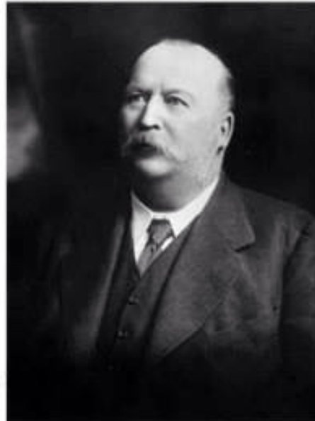
William Knox D'Arcy

Ancak İngiltere, Orta Doğu ve İran politikasına ve ekonomik ve Hindistan üzerindeki hakimiyetini güçlendirecek bu anlaşmaya hükümet olarak tam destek vermiştir. D'Arcy Şaha ekstra bir 50.000£ vererek anlaşmayı imzalamayı başarmıştır. D'Arcy 1849 yılında İngiltere'nin Devon şehrinde doğmuştur. Avustralya'ya göç ederek eski bir altın madeninin yeniden işletmiş ve zengin biri olarak tekrar İngiltere'ye dönmüştür. İngiltere'ye döndükten sonra yatırım yapacak bir iş olarak İran'da petrol aramacılığını uygun görmüş ve yukarıda bahsedilen anlaşmayı yapmıştır. İmtiyazı imzaladıktan sonra George Bernard Reynolds isimli bir jeolog işe almış ve İran'da çok zor şartlarda arama yapmaya başlamıştır. Petrol aramak için seçilen ilk alan bugün Irak toprak-