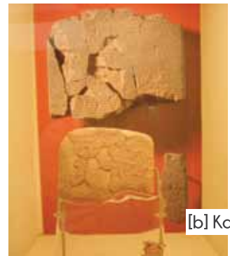
[b] Kadeş Antlaşması

MEB uygulamasında en çok sorun coğrafi durumdan kaynaklanır. Zira, dünya yuvarlak olduğu ve kıtalar homojen dağılmadığı için ülkelerin 200 mil sınırları birbirleri ile çakışmaktadır. Bu durum ülkelerin birbirleri ile anlaşılabilirliği MEB anlaşmalar ile düzenlenir. Türkiye Cumhuriyeti 1982 Birleşmiş Milletler Deniz Hukuku Sözleşmesini imzalamamış ve taraf olmamıştır. Çünkü Akdeniz kapalı bir deniz olduğu için, yetki alanı uyumsuzlukları vardır. Yine Türkiye ile Mısır'ın, Suriye ile Lübnan'ın MEB'leri iç içe girmiştir. Bölgede Kıbrısın durumu ise, MEB imzalanması için ayrı bir sorun oluşturmaktadır.