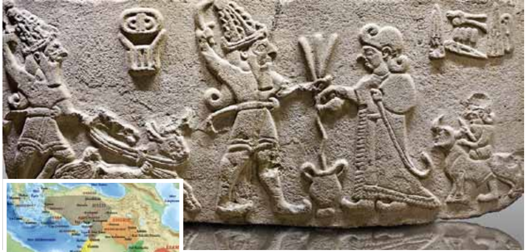
[a] Hitit İmparatorluğu

M Ö 2000'li yıllarda bölgedeki güç Hitit İmparatorluğu idi [a]. Anadolu'da Merkezi otoriteyi sağlamış olan bu devlet hedefine Suriye'yi almıştır. Suriye o dönemde doğudan gelen ticaret yollarını limanlarından avrupaya gönderen önemli bir merkez konumundaydı. Bu ticaret rotası aynı zamanda Kıbrıs'ı da içine almaktaydı. Ayrıca bu bölgenin güneyinde dönemin bir başka gücü, Mısır Krallığı bulunmaktaydı. Dolayısı ile Doğu Akdeniz limalarına hakim olmak doğudan gelen ticari malların el değiştirme noktasına hakim olmaktı. Bu sebeple dönemin iki dev ülkesi MÖ 1275 yılında Suriye'deki Kadeş ovasında karşı karşıya gelmişlerdir. MÖ 1259 yılında III. Hattuşili ile II. Ramses arasında Kadeş Antlaşması, Suriye topraklarının paylaşıldığı, Dünyanın ilk yazılı barış antlaşmasıdır. Orijinal metin İstanbul Arkeoloji Müzesinde sergilenmektedir [1] [b].